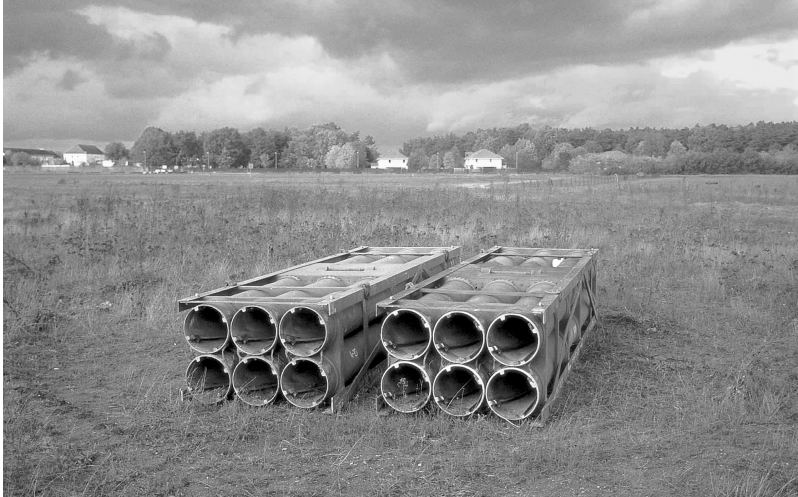
독일베벤하우젠 미군 포병대대