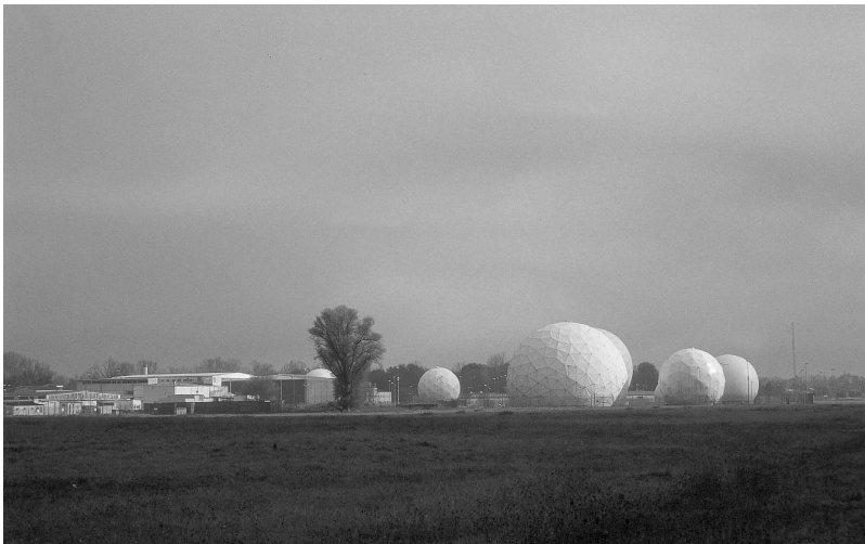
뮌헨 파싱 에셀론