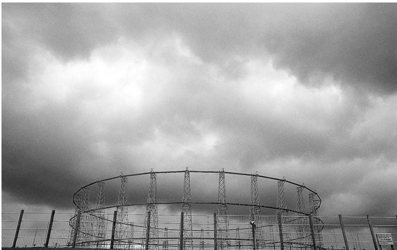
오кина와 요미탄손 통신시설