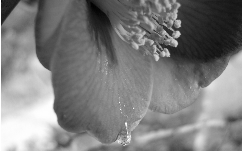
제주 도두봉 동백꽃눈물