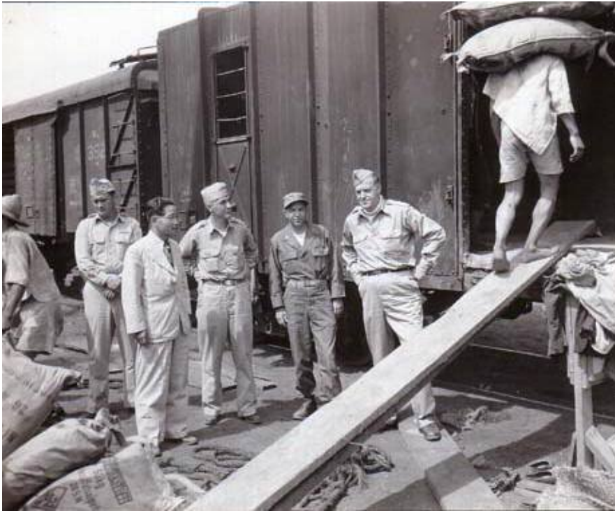
자료사진2 한국민사원조사령부의 활동사진 35)