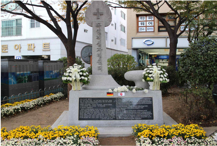
자료사진1 독일적십자병원 기념비는 당시 산부인과 의사였던 최하진과 환자였던 이한식이 세웠다. 28)

서독의 의료단지원이 한국을 위한 것인지, 미국을 위한 것인지, 아니면 서독 자신을 위한 것인지 의심될 만한 정황 속에 특별한 반성없이 독일은 다시 “유엔사”가입을 결정했다. 독일의 결정의 정당성이 의심된다.